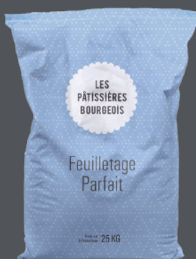
石磨麵粉T55 (派皮專用)